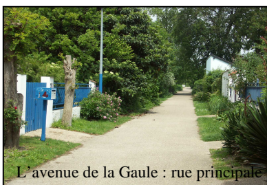
L'avenue de la Gaule : rue principale

Avant 1961, l'accès à l'île ne se faisait que par barques ou en marchant sur les passerelles des écluses, ce qui était très dangereux. Aussi, en 1961, une passerelle piétonne fut construite au-dessus des écluses, pour en faciliter l'accès. C'est toujours cette passerelle unique qui en constitue l'accès et qui donne à cette île son charme particulier et son caractère calme très recherché.