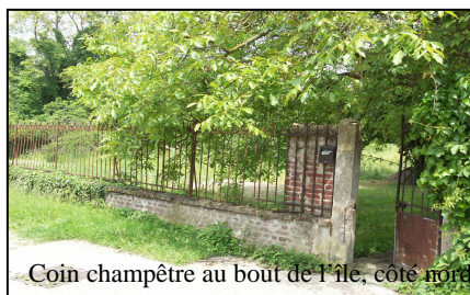
Coin champêtre au bout de l'île, côté nord