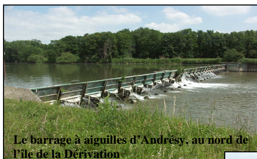
Le barrage à aiguilles d'Andrésy, au nord de l'île de la Dérivation