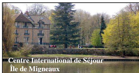
Centre International de Séjour Île de Migneaux