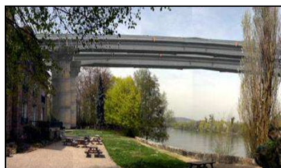
Simulation passage des 2 viaducs de l'A104 Au dessus de l'île de Migneaux et de la Galiotte.